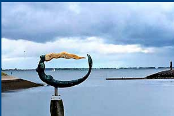
Zeemeermin van Léon Vermunt